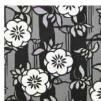
四君子文BK (しくんしもん)