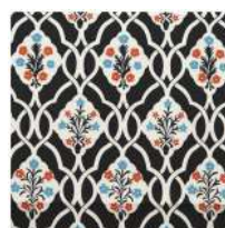
花立湧BK (はなたちわく)